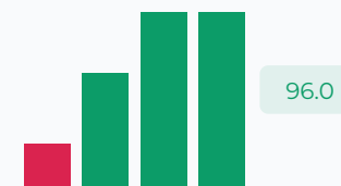
Значение ФОТ в выручке, %