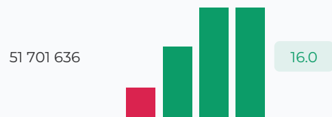
Доля СВ в выручке, %