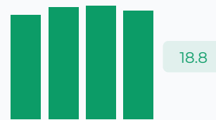
Доля НДС к выручке, %