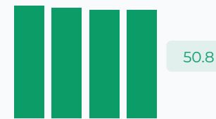
Значение ФОТ в выручке, %