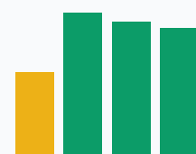
Значение ФОТ в выручке, %