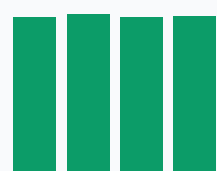
Доля НДС к выручке, %