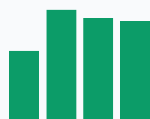
Доля СВ в выручке, %